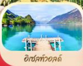
อีเซลท์วอลด์