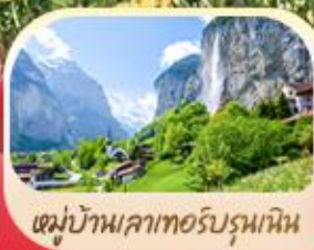
หมู่บ้านเลาเทอร์บรุนเนน