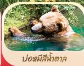
ป้อมีสีน้ำตา